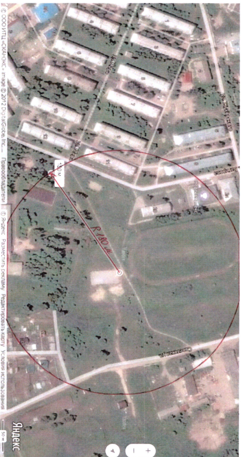
Схема границ прилегающих территорий, на которых не допускается продажа алкогольной продукции, включая продажу алкогольной продукции, осуществляемую организациями и индивидуальными предпринимателями при оказании услуг общественного питания, муниципального бюджетного учреждения «Спортивная школа «Искра» поселка Кедровый Красноярского края» по адресу: ул. Жуковского, 10;

Приложение № 12 к постановлению администрации поселка Кедровый Красноярского края от 16.01.2020 № 16-п