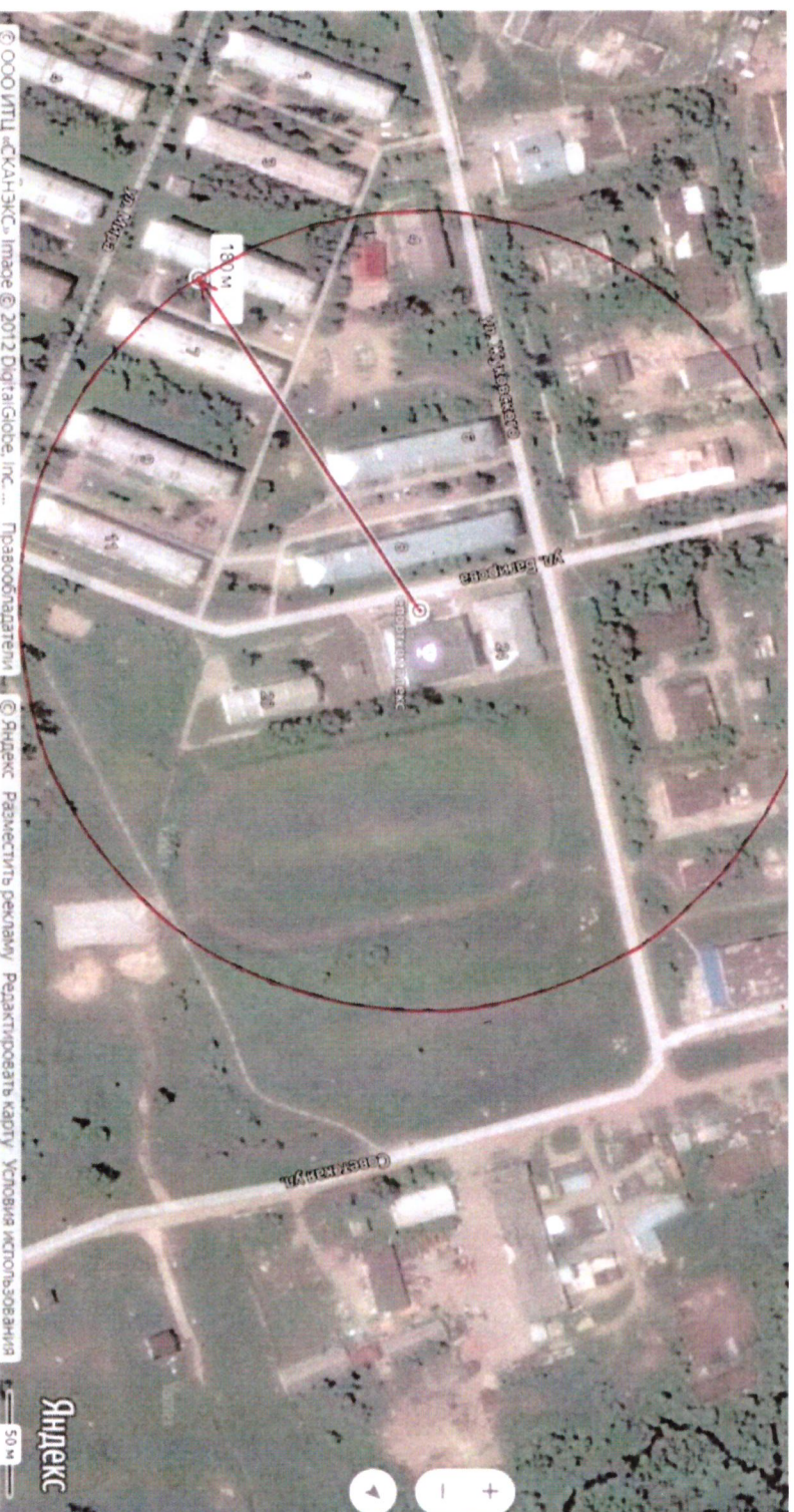
Схема границ прилегающих территорий, на которых не допускается продажа алкогольной продукции, включая продажу алкогольной продукции, осуществляемую организациями и индивидуальными предпринимателями при оказании услуг общественного питания, муниципального бюджетного учреждения «Спортивная школа «Искра» поселка Кедровый Красноярского края» по адресу: ул. Багирова, 22;

Приложение № 10 к постановлению администрации поселка Кедровый Красноярского края от 16.01.2020 № 16-п