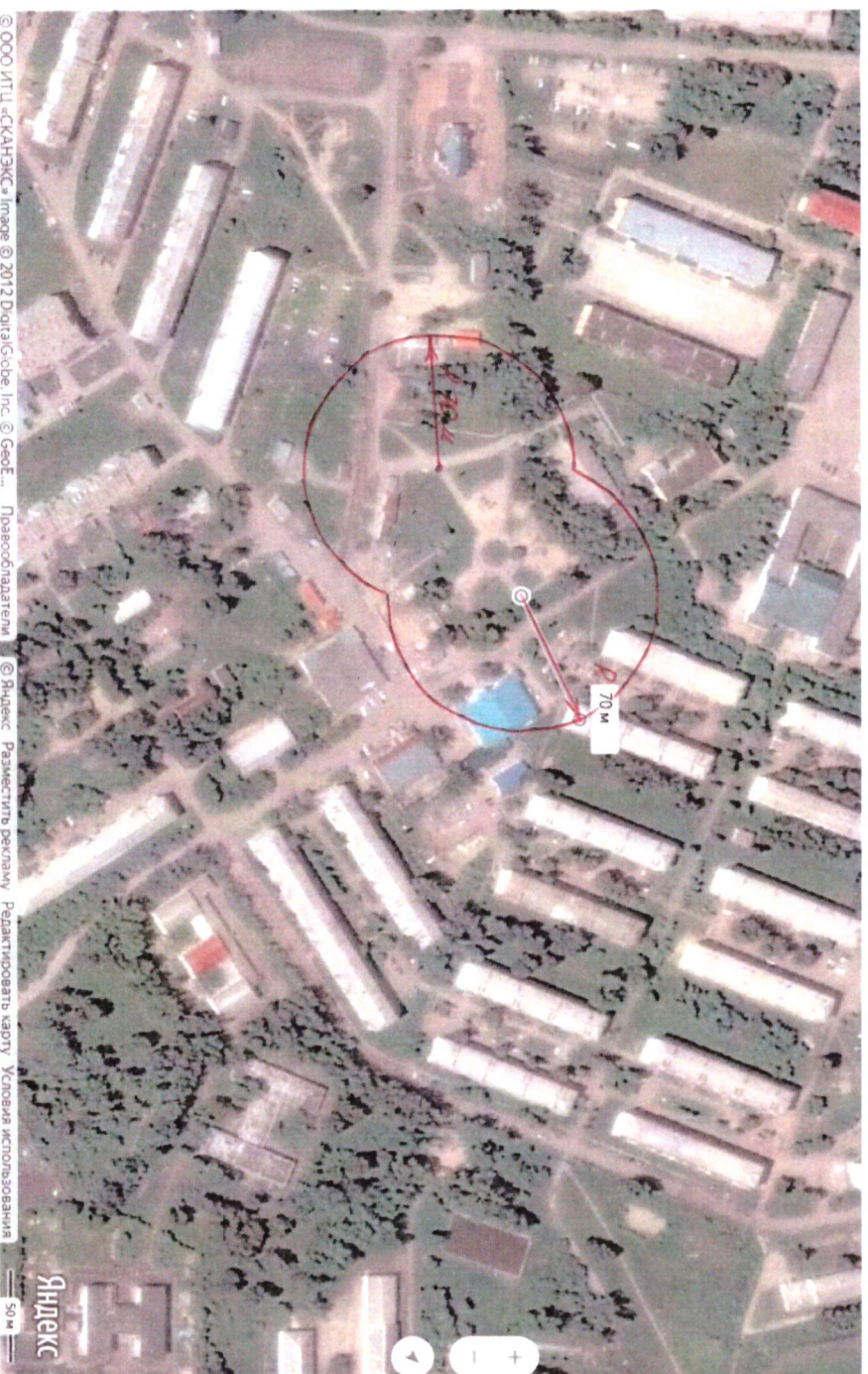
Схема границ прилегающих территорий, на которых не допускается продажа алкогольной продукции, включая продажу алкогольной продукции, осуществляемую организациями и индивидуальными предпринимателями при оказании услуг общественного питания, «Центральный сквер» по адресу: ул. Дзержинского, участок 2 «а»

Приложение № 8 к постановлению администрации поселка Кедровый Красноярского края от 16.01.2020 № 16-п