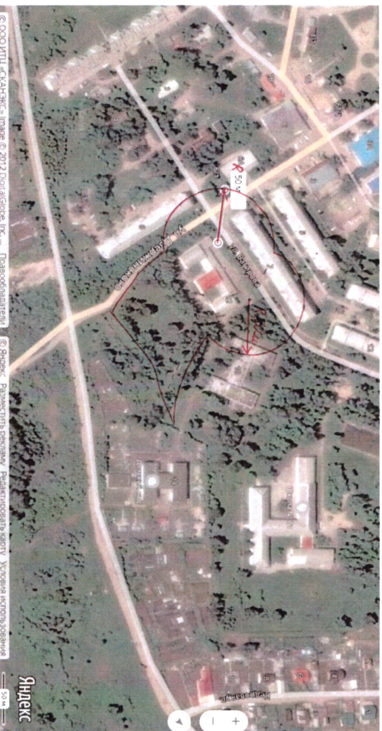
Схема границ прилегающих территорий, на которых не допускается продажа алкогольной продукции, включая продажу алкогольной продукции, осуществляемую организациями и индивидуальными предпринимателями при оказании услуг общественного питания, муниципальной бюджетного общеобразовательного учреждения «Средняя общеобразовательная школа №71 п. Кедровый» Красноярского края по адресу: ул. Багирова, 12

Приложение № 2 к постановлению администрации поселка Кедровый Красноярского края от 16.01.2020 № 16-п