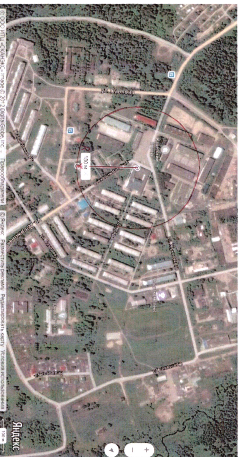
Схема границ прилегающих территорий, на которых не допускается продажа алкогольной продукции, включая продажу алкогольной продукции, осуществляемую организациями и индивидуальными предпринимателями при оказании услуг общественного питания, муниципального бюджетного учреждения «Спортивная школа «Искра» поселка Кедровый Красноярского края» по адресу: ул. Жукковского, 2, помещение 2;

Приложение № 9 к постановлению администрации поселка Кедровый Красноярского края от 16.01.2020 № 16-п