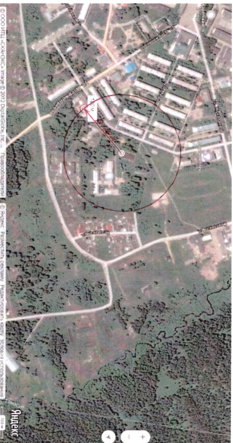
Схема границ прилегающих территорий, на которых не допускается продажа алкогольной продукции, включая продажу алкогольной продукции, осуществляемую организациями и индивидуальными предпринимателями при оказании услуг общественного питания, открытого плоскостного сооружения муниципального бюджетного общеобразовательного учреждения «Средняя общеобразовательная школа №71 п. Кедровый» Красноярского края, по адресу: ул. Багирова, 18

Приложение № 14 к постановлению администрации поселка Кедровый Красноярского края от 16.01.2020 № 16-п