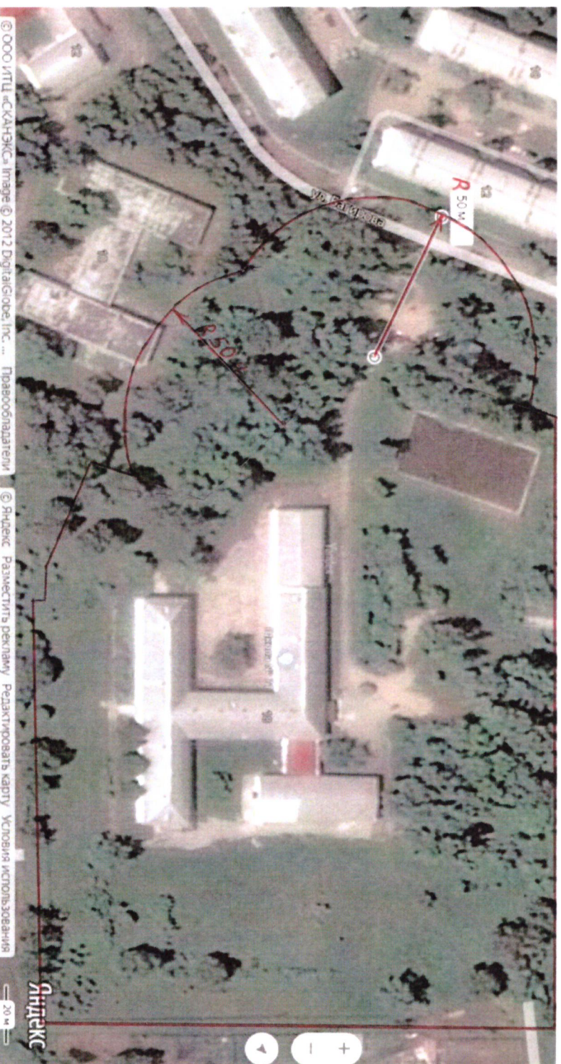
Схема границ прилегающих территорий, на которых не допускается продажа алкогольной продукции, включая продажу алкогольной продукции, осуществляемую организациями и индивидуальными предпринимателями при оказании услуг общественного питания, муниципальной бюджетного общеобразовательного учреждения «Средняя общеобразовательная школа №71 п. Кедровый» Красноярского края по адресу: ул. Багирова, 18

Приложение № 3 к постановлению администрации поселка Кедровый Красноярского края от 16.01.2020 № 16-п