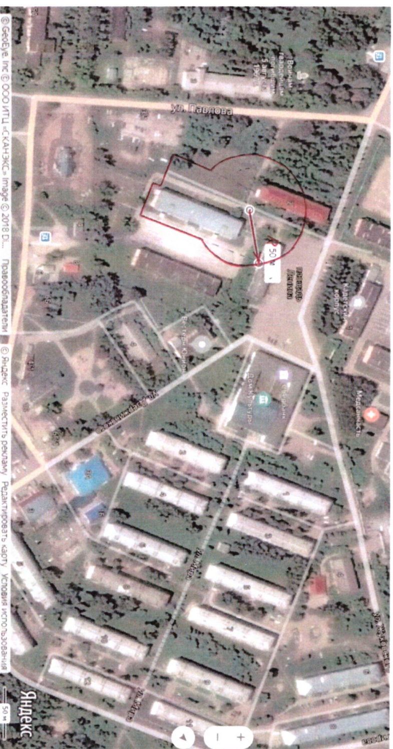
Схема границ прилегающих территорий, на которых не допускается продажа алкогольной продукции, включая продажу алкогольной продукции, осуществляемую организациями и индивидуальными предпринимателями при оказании услуг общественного питания, краевого государственного бюджетного общеобразовательного учреждения «Кедровый кадетский корпус» по адресу: пл. Ленина, 2, строение 1

Приложение № 5 к постановлению администрации поселка Кедровый Красноярского края от 16.01.2020 № 16-п