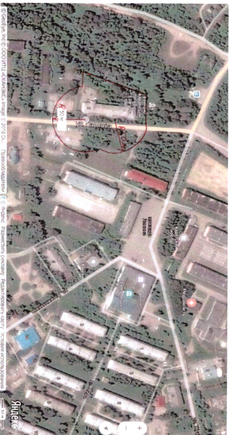
Схема границ прилегающих территорий, на которых не допускается продажа алкогольной продукции, включая продажу алкогольной продукции, осуществляемую организациями и индивидуальными предпринимателями при оказании услуг общественного питания, краевого государственного бюджетного учреждения здравоохранения «Больница п. Кедровый» по адресу: ул. Павлова, 3

Приложение № 7 к постановлению администрации поселка Кедровый Красноярского края от 16.01.2020 № 16-п