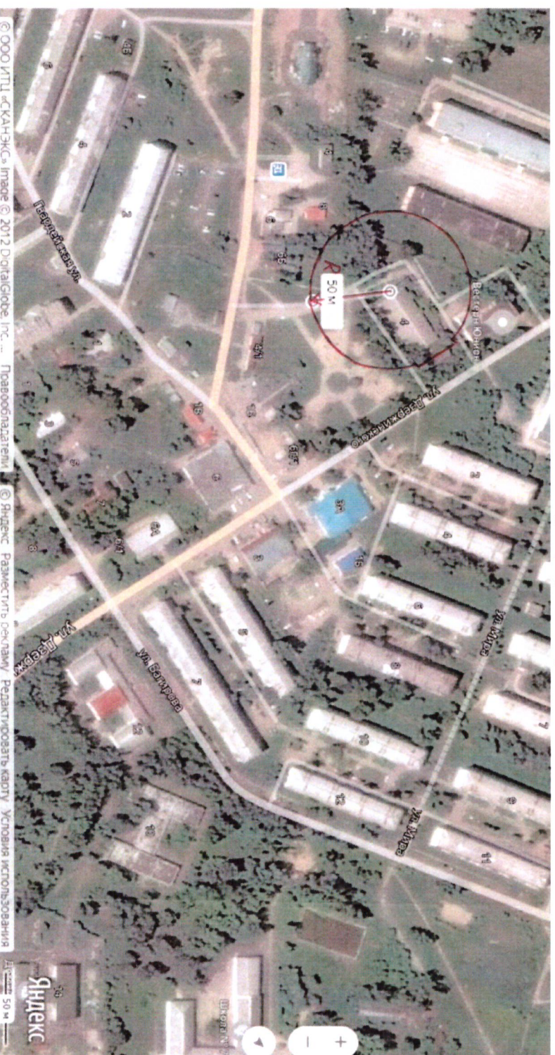
Схема границ прилегающих территорий, на которых не допускается продажа алкогольной продукции, включая продажу алкогольной продукции, осуществляемую организациями и индивидуальными предпринимателями при оказании услуг общественного питания, муниципального учреждения дополнительного образования «Детская музыкальная школа» п. Кедровый по адресу: ул. Дзержинского, 4 «а»

Приложение № 4 к постановлению администрации поселка Кедровый Красноярского края от 16.01.2020 № 16-п