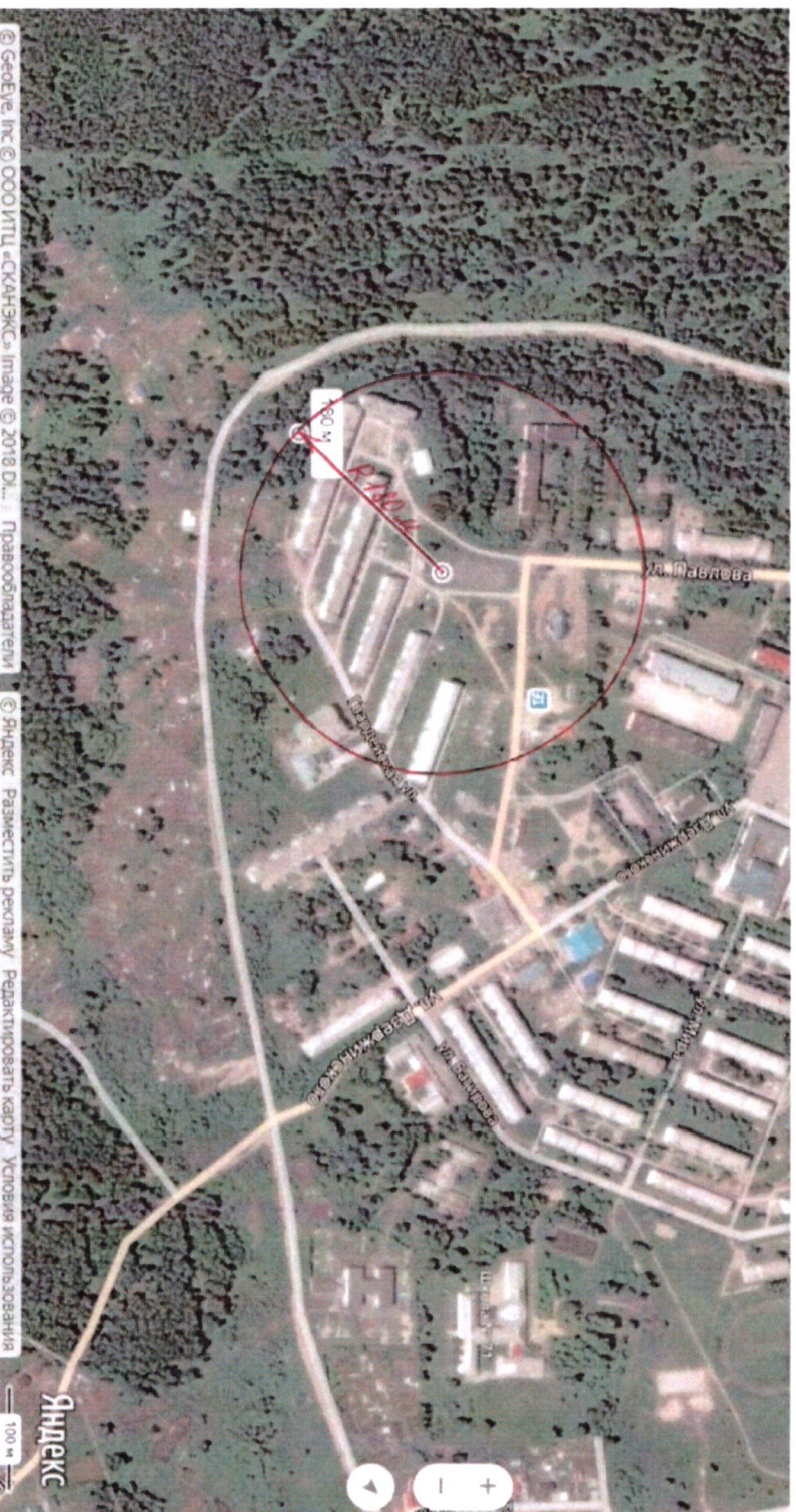
Схема границ прилегающих территорий, на которых не допускается продажа алкогольной продукции, включая продажу алкогольной продукции, осуществляемую организациями и индивидуальными предпринимателями при оказании услуг общественного питания, муниципального бюджетного учреждения «Спортивная школа «Искра» поселка Кедровый Красноярского края» по адресу: ул. Павлова, 7

Приложение № 13 к постановлению администрации поселка Кедровый Красноярского края от 16.01.2020 № 16-п